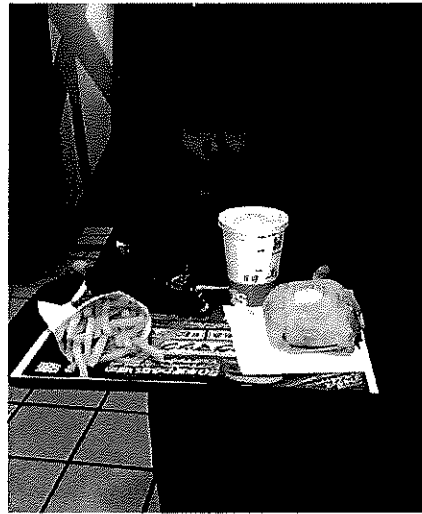
4月21日、マクドナルドで仕事体験(マックアドベンチャー)をする奏太。

平成30年3月28日 判決 認容額2250万円／請求額4080万円 平成26年8月、四国中央市の老人ホーム入居者が、別の利用者に出す予定の白玉だんごを食べ窒息し、9か月後に死亡。 「女性は認知症であるうえ、背中が丸まった状態で、粘着性と弾力性があるだんごを口に入れればのどにつまらせて窒息することは予見できた。女性の手が届く範囲にだんごを置かないなど、注意義務を怠っていた」と指摘。 一方で、「女性のほかの施設での食事内容や介護の状況が関係者から詳しく伝わっていれば、事故を防ぐことができた可能性もある」として、施設側の過失割合を7割と認定した。